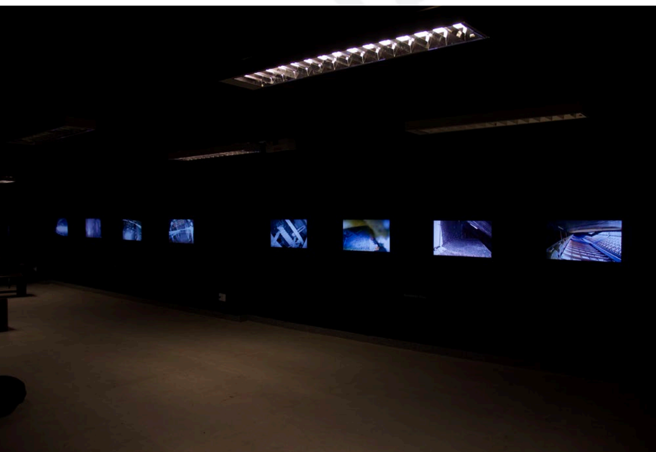
Exposição "Nós Precisamos", Exposição.

Enfim, uma busca do inacessível, do acontecimento menor. "É quase uma fotografia, mas de repente algo inusitado passa por ali, produz uma pequena turbulência, ou pode não acontecer nada. É uma incógnita." (Fernando Pião)