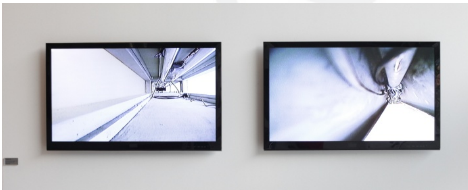
Exposição "Escala Humana", Montagem.

fundo subir, lançando luz ao que está na sombra, para espreitar esse universo que se mantém indiferente ao nosso, a tudo que nos é comum. Neste sentido, as imagens resultantes não fazem parte de uma estética de consumo ou talvez nem mesmo de inteligibilidade. Quase imagem.