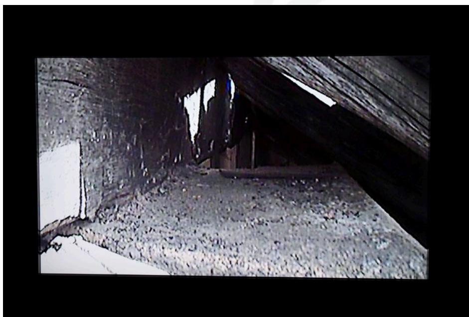
Exposição "Nós Precisamos", detalhe de uma das câmeras.