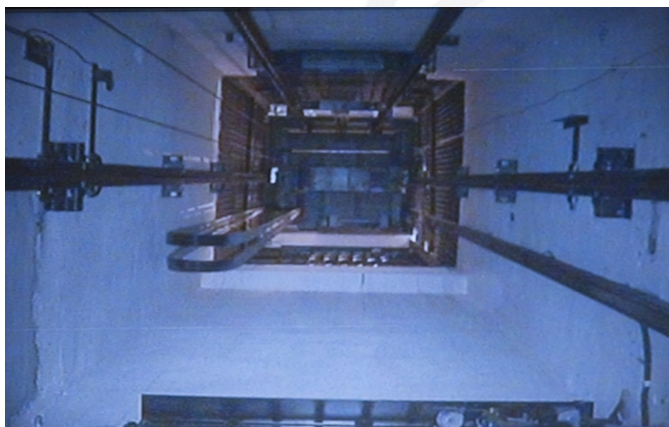
Exposição "Bienal do Mercosul - Projetáveis" – Detalhe de uma das câmeras.

Fernando Pião produz com esse gesto um deslocamento da função de vigilância das câmeras, desviando o foco do controle social para trazer paisagens outras, revelando o lado não evidente das coisas, dos lugares, o “lado obscuro”. Propõe, assim, outras articulações com o espaço, fazendo o