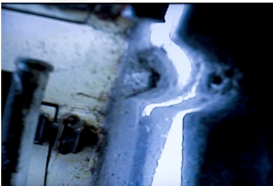
Exposição "Escala Humana", detalhe de uma das câmeras.

Daí o interesse por esses lugares inexplorados, por tudo o que pode ser inexpressivo para as câmeras de segurança. Nesses recantos supõe-se não haver nada a ser gerido e padronizado, pois é o que não foi domado, o que está "fora" do que Michel Foucault chamou de "diagrama de forças" que